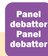
Politiker Beslutsfattare Nyckelpersoner