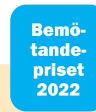
Avslöjande och prisutdelning