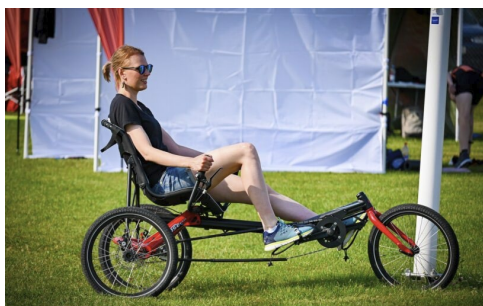
Figur 1 Person som testar idrottsutrustning