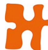
Figur 1 Förbundets logo