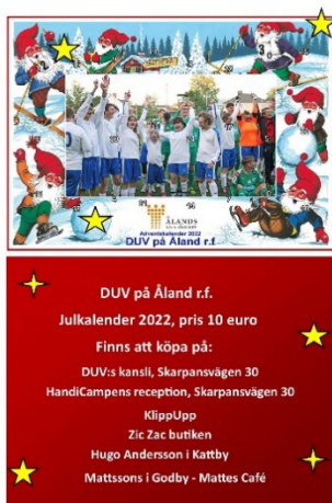
Figur 2 Pärbild på DUV:s julkalender

Både DUV:s och Reumaföreningens kalendrar kan köpas i förbundets reception för 10 € vardera.