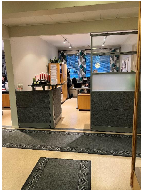
Bild av den ena receptionen.

teleslinga i receptionen för de med hörselnedsättningar. Det ligger lösa mattor som kan orsaka snubbelrisk.