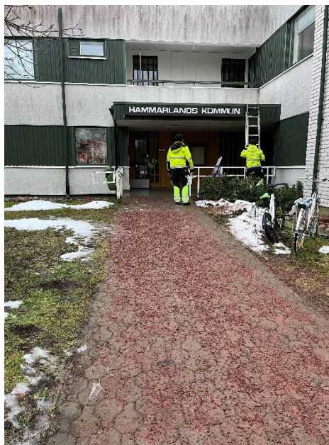
Bild av ramp gjord av gatsten som leder till entrén.

Dörrbredden till huvudentrén är acceptabel och det finns en låg tröskel. Det finns god svängyta på utsidan av entrén och på insidan för att svänga med hjälpmedel.