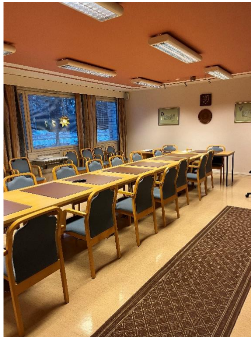
Bild av sammanträdesrummet.

Det finns ingen skylt som indikerar att detta är sammanträdesrummet och det finns inte tillgång till teleslinga. Akustiken i rummet är god och fritt från efterklanger. Dörrpassagebredden mellan sammanträdesrummet och till korridoren mot den vänstra del av byggnaden är 75 centimeter, rekommenderad dörrpassagebredd är 80 centimeter.