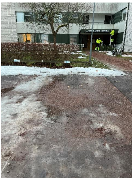
Bild av parkering för de med särskilt tillstånd.

Det finns skyltar vid vägen som indikerar var Hammarlands kommunkansli är och det finns gott om parkeringsplatser. Skylten som hänvisar till parkeringen för de med särskilt tillstånd är liten och svårläst på avstånd. Den skulle behöva göras större så att det är lättare att upptäcka den. Det saknas även markering av parkeringen för personer med särskilt tillstånd på asfalten. Parkeringsplats för personer med särskilt tillstånd vid arbetsplatser bör utrustas med eluttag för bilvärmare. Parkering och angöringsplats ligger i nära anslutning till huvudentrén. Markunderlaget är asfalt och jämnt.