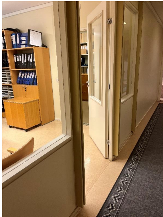
Bild av ingång till ekonomichefens kontor

Dörrpassagebredden till HR-ansvarigs rum är 70 centimeter, dörrbredden är rekommenderad att vara minst 80 centimeter. Tröskeln in till rummet är låg och kontoret är rymligt med god svängyta. Det finns persienner för att avskärma dagsljus och akustiken är god. I korridoren utanför rummet finns en klädmajor.