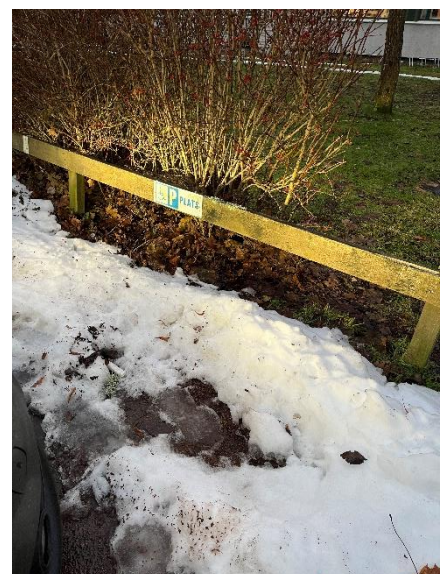
Bild av skylt för de med särskilt tillstånd.