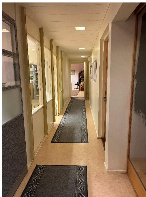
Bild av korridoren som leder till sammanträdesrummet och lösa mattor.

Korridoren som leder från entrén till sammanträdesrummet är 1,10 m bred, kravet för en tillgänglig korridor är 1,3 meter. Det går inte att vända med hjälpmedel i korridoren om personen inser att de är på väg fel för att korridoren är lång och trång. Det ligger även lösa mattor i korridoren som kan orsaka snubbelrisk. Detta kan åtgärdas med mattejp eller gummi under mattorna. Till vänster om receptionen finns det en pelare i korridoren, denna behöver kontrastmarkeras så att personer med nedsatt syn kan upptäcka den. Detta kan göras i två olika höjder, en vid ögonhöjd och ytterligare en markering vid en höjd på cirka 80-100 centimeter.