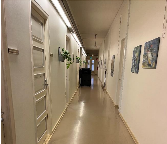
Bild 12 på skrivare och element i korridor på våning tre.