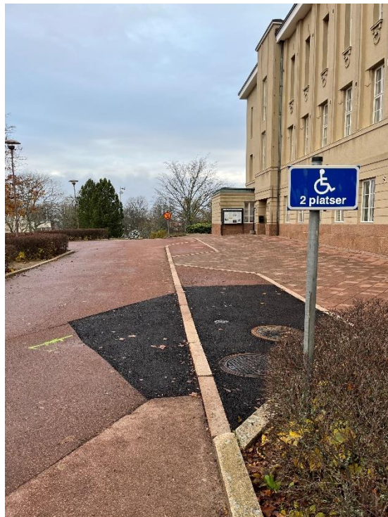
Bild 1 av angöringsplats och parkering för de med särskilt tillstånd.

Angöringsplats och parkering för de med särskilda tillstånd finns inom ett avstånd kortare än 25 meter från entrén. Det finns två platser utmed gatan och det är gott om plats på bägge sidor om parkeringsrutan. Det saknas markering eller symbol på marken. Markunderlaget från parkeringen till entrén består av halkfria stenplattor. Marken utanför huvudentrén lutar både åt sidled och rakt framifrån vilket försvårar framkomlighet.