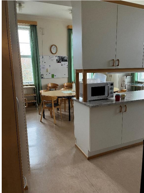
Bild 15 av köket.