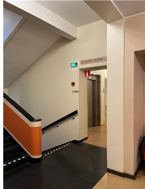
Bild 7 av Skyltning till hiss.