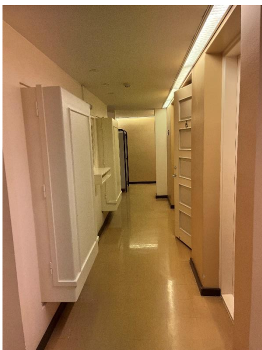
Bild 9 vändyta korridor utanför toalett.

Belysningen går i gång via en sensor och dörren har engreppslås samt ett draghandtag som underlättar för stängning av dörren. Handfat och spegel sitter i lagom höjd och toaletten har armstöd på båda sidor. Det är 1,10 meter från toalettstolen till väggen och det finns gott om plats på båda sidor om toalettstolen. Bidéduschen sitter långt ifrån toalettssitsen och är svår att nå. Det finns inget larm eller larmanordning i toaletten.