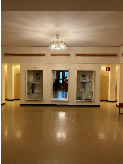
Bild 6 av skyltning tillgänglig toalett till vänster.

Om man går rakt fram från receptionen kommer man till ett kaprum och till den andra entrén av byggnaden, vilken är öppen vid föreställningar. Det saknas skyltning för att kunna orientera sig. Det finns ett eko i rummet och ljudnivån kan snabbt stiga. Krokarna för att hänga av sig sitter alldeles för högt. Det finns ett fåtal på lägre nivå men det är inte tillräckligt. Sittplatserna som finns i kapprummet är låga och de saknar armstöd. Det finns ett par soffor med armstöd. Det finns en skylt till hissen, se bild 7, men man måste stå vid ett visst läge för att kunna se den.