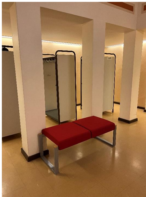
Bild 8 av sittplats utan armstöd och fåtal krokar på lägre höjd.