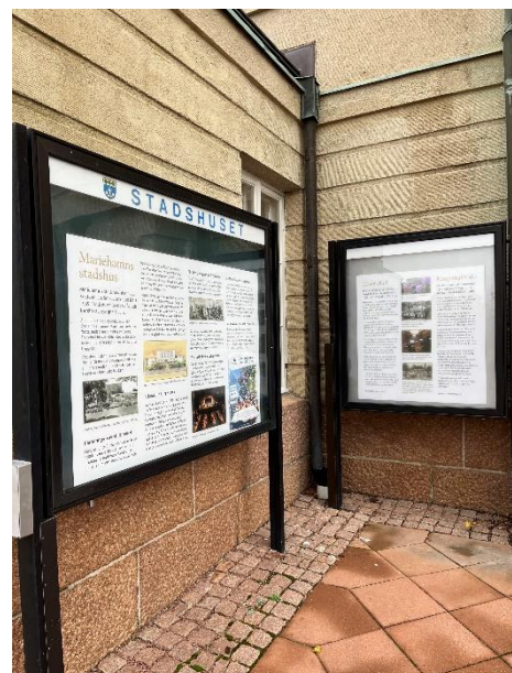
Bild 17 av skyltningar vid huvudingång.