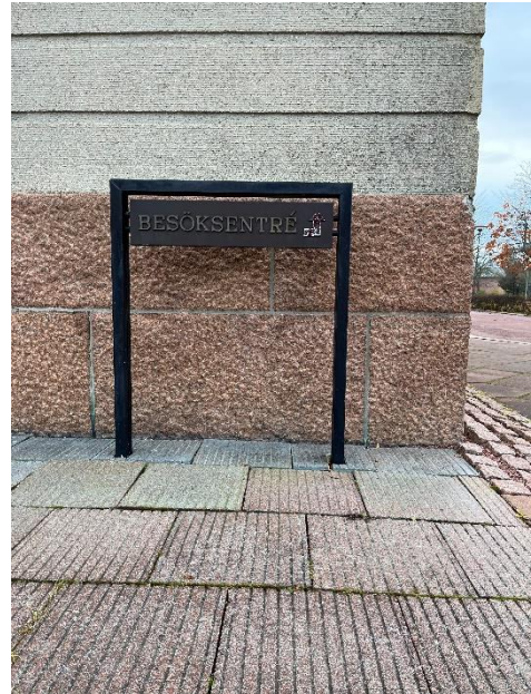
Bild 3 av infoskylten till huvudentré.