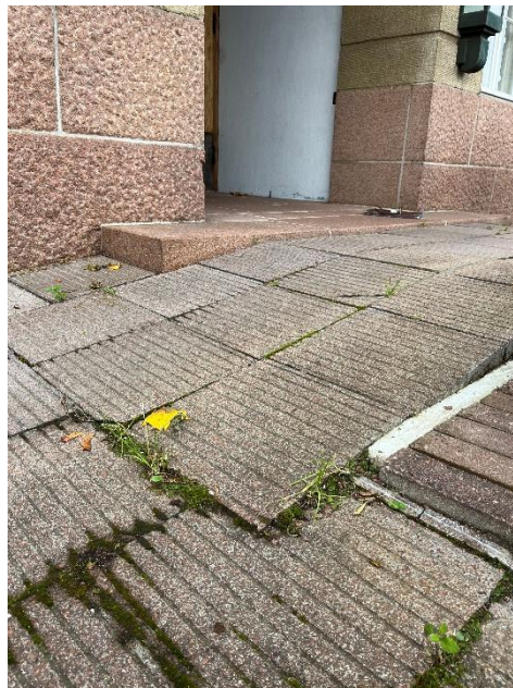
Bild 4 av ramp utanför norra entré, saknar avåkningsskydd.