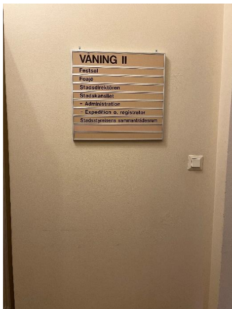
Bild 16 på skyltning våning två.

De skyltar som finns är inte lätta att se och skyltningen till alla allmänna utrymmen är bristfälliga för enkel orientering. Det är kallt på vintern i byggnaden och varmt på sommaren, ventilationen är inte så god. Ventilationen består av luckor på byggnaden som man öppnar och vintertid håller man dem stängda.