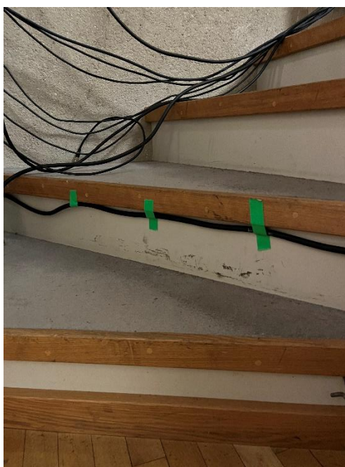
Bild 11 av trappor upp till scenen med trappnos.

Dörrbredden in till festsalen är tillräcklig och det finns möjligheter att möblera om stolar så att personer med hjälpmedel kan sitta. Det finns trappor med en ledstång upp till scenen. Trapporna har en kant, dessa kallas för trappnos, som sticker ut vilket kan försvåra när man ska gå uppför trappan. Det finns risk att fastna och snubbla, (se bild 11). Det finns tillgång till Teleslinga i detta utrymme.