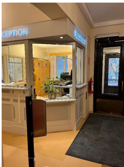
Bild 5 av receptionen med full belysning bakom texten.

Det finns en skylt som lyser ovanför receptionen på vardera sida om disken. Med stark belysning bakifrån framträder bokstäverna bättre vilket ger texten en skuggning, annars syns texten inte så bra. Det finns inga skyltar i utrymmet, här anmäler man sitt besök och en person dyker upp för att hämta individen. Det finns teleslinga och det finns tillgång till en ringklocka. Det finns en sänkt del av receptionen som är anpassad för tillgänglighet. Rakt framför receptionen finns kapprum, tillgänglig toalett, trappor och en hiss. Dörrar till korridorerna är låsta och öppnas av receptionisten.