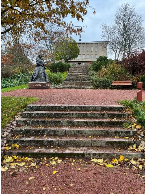
Bild 2 av vägen genom parken till norra entrén.

Rampen till norra ingången är 6,9 grader och det bör vara en lutning på max 4,7 grader. Det finns inte heller ett avåkningsskydd om minst 4 cm högt på rampen. Dessutom saknas en automatisk dörröppnare till den ingången och dörren är tung att öppna.