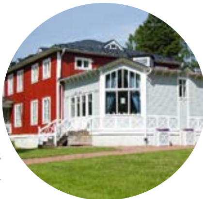
Bild 5. Lemböte lägergård.