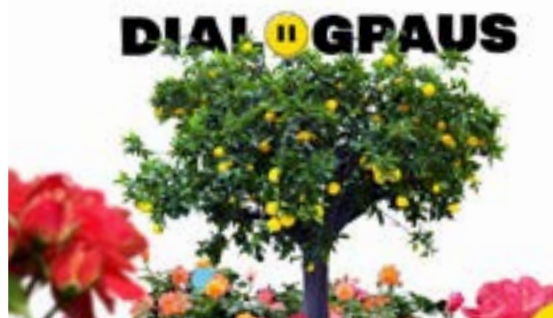
Bild 4. Dialogpaus 30 maj.