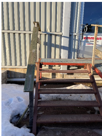
Bild 7. Det är en kort trappa upp till inlämningen