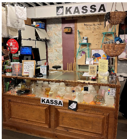
Bild 3. Disken i butiken.

Entré: Det är en hög tröskel (7 cm) för att komma in i butiken genom dörren. Dörren är också ganska tung att öppna. Dörren sitter i en större garageport som kan öppnas från insidan vid behov, det finns ett telefonnummer utanför som man kan ringa och nå personalen för hjälp, vilket är en lösning för de med hjälpmedel som inte kommer genom dörren.