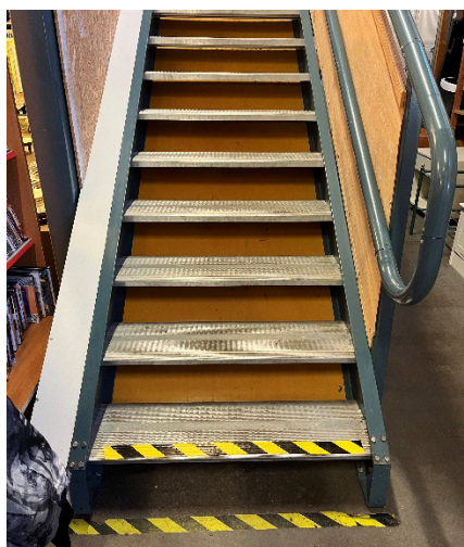
Bild 4. Trappan nära ingången

I andra änden av butiken finns en till trappa som vi upplever som mindre tillgänglig än den första, här är trappstegen 29 cm djupa och 18 cm höga. Trappstegen är i trä med en ojämn yta, trappan upplevs som svår att gå i på grund av det. Trappan har kontrastmarkering på första och sista trappsteget. Ledstång finns på ena sidan, på andra sidan är en fyrkantig ledstång/del av trappan som är svårare att hålla i.