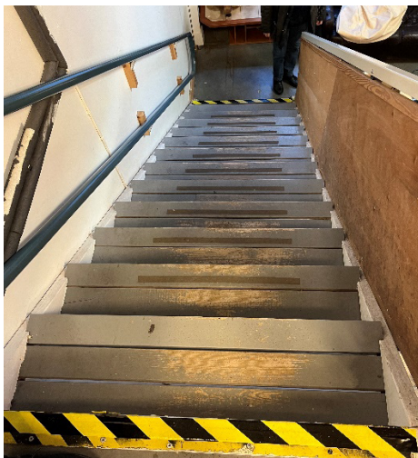
Bild 5. Trappan längre in i butiken

Gångar: Butiken är fullpackad av varor och det kan vara svårt att ta sig fram i relativt trånga gångar mellan möbler och föremål. Något som också försvårar tillgängligheten är att varorna ofta byts ut och därmed också möbleringen inne i butiken. Det finns även föremål i ansiktshöjd som sticker ut och hänger från taket.