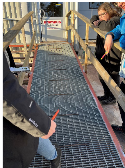
Bild 8. Rampen som leder upp till inlämningen