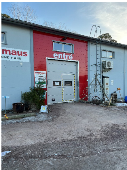
Bild 1: Entrén till Emmaus butik i Norrböle, en garageport med mindre dörr inne i porten.