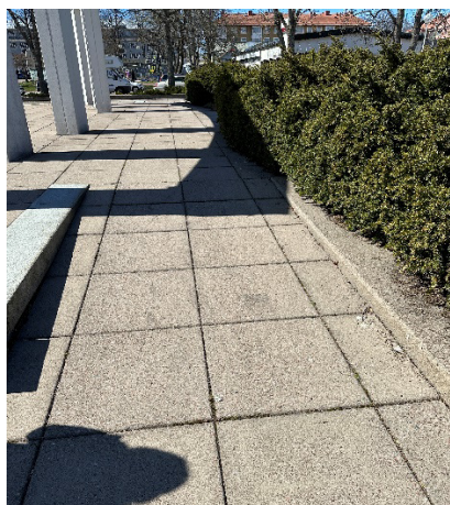
Bild 4. Gångvägen med lutning som är för brant.

Den mittersta gångvägen går på bägge sidor om en arkitektonisk design med vatten som bildar vad som utgör mycket farliga hinder för alla som går där, men särskilt för personer med funktionsnedsättning. De är inte utmärkta och det finns inga räcken eller kanter (se bilden). Här kan någon göra sig illa genom att ramla ner i hålen. Dessa kommer avlägsnas enligt landskapets nya förslag för parkens utformning och det understöds av gruppen.