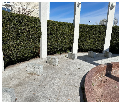
Bild 6. Fundament till träbänken