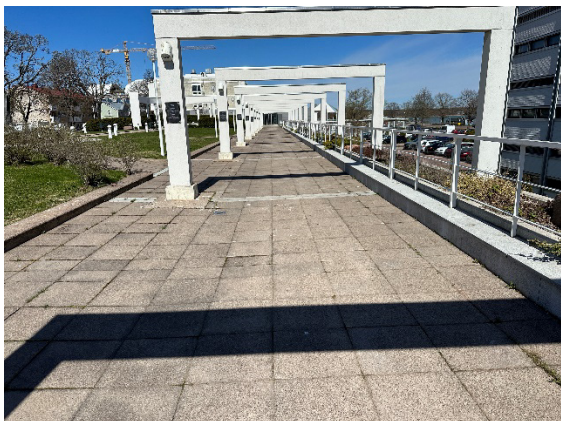
Bild 2. Gångvägen under arkadbågarna