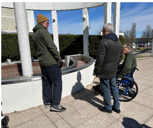
Bild 5. Vattenfontänen

I mitten av parken finns en vattenfontän med konstverket ”Ståtbådan” i mitten. Runt konstverket finns en stenlagd gång med tillräcklig bredd. Här finns en bred och synlig kant till fontänen. Det finns inga sittplatser i närheten av konstverket.