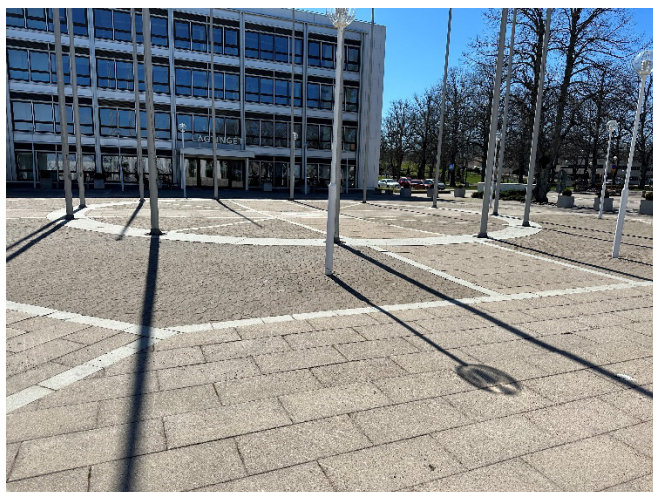
Bild 1. Här syns både torget med flaggstängerna samt skylten ovanför lagtingets entré.

Skyltar bör ha tillräckligt stor stil, god kontrast, vara lätta och förstå och finnas på en höjd som går att läsa både när man står och sitter ner.