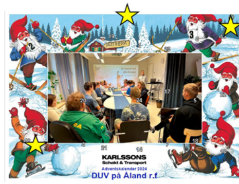
Bild 6. Julkalender.