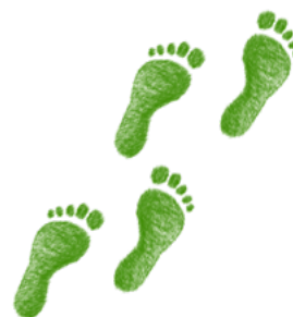
Bild 1. Fotsteg