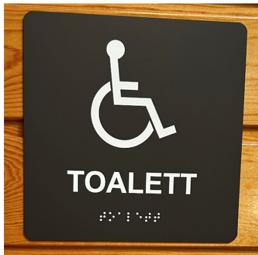
Bild av skylt med symbol och relief tillgänglig toalett.

Det är viktigt att använda sig av den erkända rullstolssymbolen och att skylten är lättläst. En annan viktig aspekt är att toaletten ska vara könsneutral. Längre ord i relief är svåra att läsa men det fungerar bra för korta ord såsom WC och symboler.