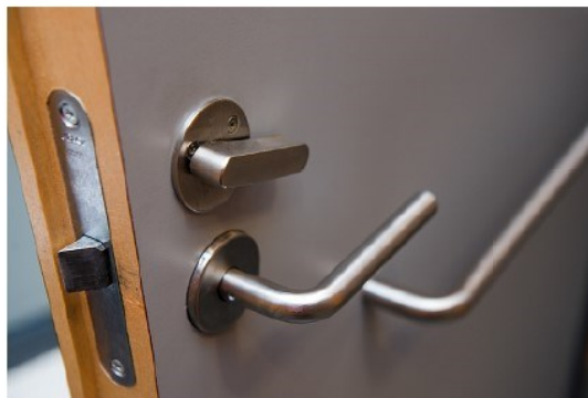
Bild av lås med enhandsfattning.

Låset ska vara lätt att hantera med en hand, detta innebär att det ska vara utformat för enhandsgrepp. Ett lås med en liten vridning är acceptabelt också. Kontraster är viktigt för personer med synnedsättningar. När det gäller låset är en god kontrast rött för upptaget.