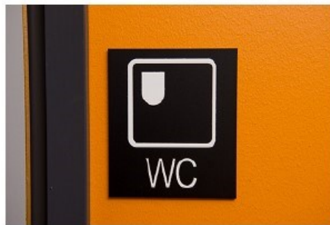
Bild av skylt som anger höger överföring.