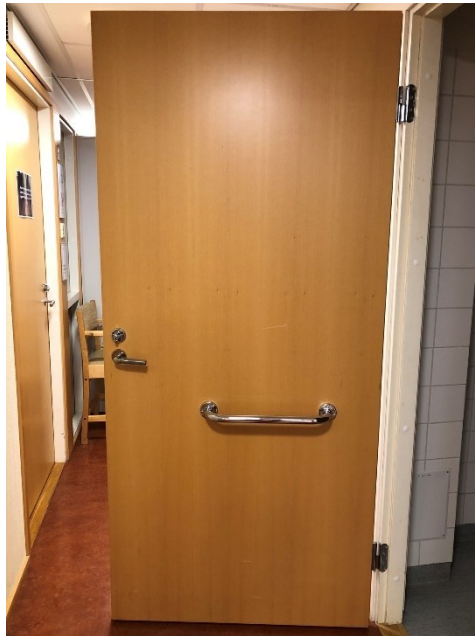
Bild av draghandtag innanför toalettdörren.

På dörrens insida bör det finnas ett draghandtag så att personer kan stänga dörren självständigt efter sig. En lämplig höjd är en installation på en höjd av 80 centimeter från golvet och att draghandtaget är en meter lång.