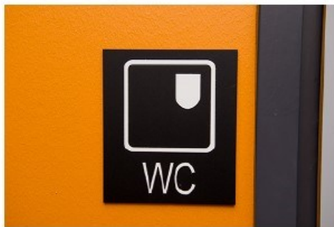
Bild av skylt som anger vänster överföring.

Det ska vara möjligt att göra en överföring från både vänster och höger sida. Detta innebär att det ska finnas nog med utrymme på båda sidor om toaletten. Om det inte är möjligt bör det finnas minst två toaletter som är spegelvända och en skylt på dörren som hänvisar från vilken sida överföringen är möjlig från hjälpmedlet till toasitsen.