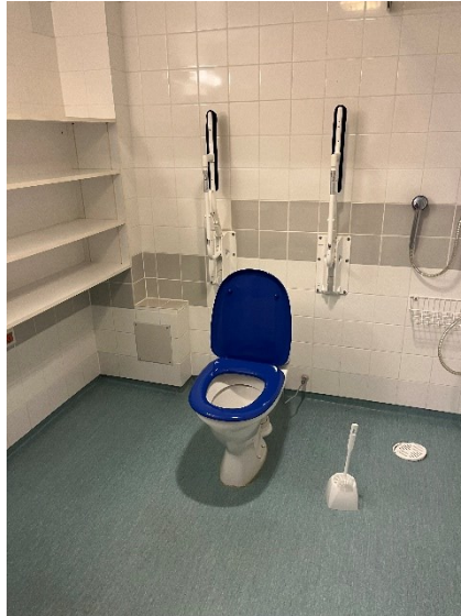
Bild av kontraster toalettstol och armstöd.

Det är viktigt att det finns armstöd installerat på båda sidor av toaletten och att de är uppfällbara. En lämplig höjd är 75–80 centimeter från golvnivån och mellan armstöden bör det finnas ett avstånd på 60 centimeter. Det är viktigt att de kan spärras fast för att undvika att de rör på sig under användning. Längden ska vara tillräckligt lång att de når tillräckligt långt fram till framkanten av toalettstolen.