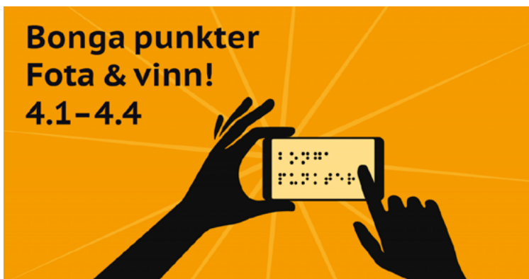
Bild 2. Bonga punkter.