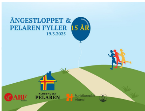
Bild 4. Ångestloppet.