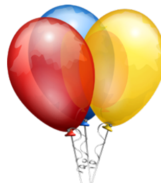
Bild 7. FUN-kalas.