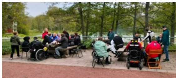
Grillkväll på Lilla Holmen 2025

Dags för vår traditionella grillkväll torsdag 11 juni kl.18.00 vid Lilla Holmen i Mariehamn. Välkommen till en avslappnad kväll med trevlig samvaro. Föreningen bjuder på grillad korv, dryck och fika. Anmäl dig senast 8 juni .