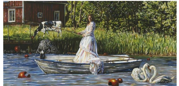
Ett av Caroline af Ugglas konstverk

Anmäl dig senast 7 april kl.11.00 . Meddela eventuella allergier vid anmälan.