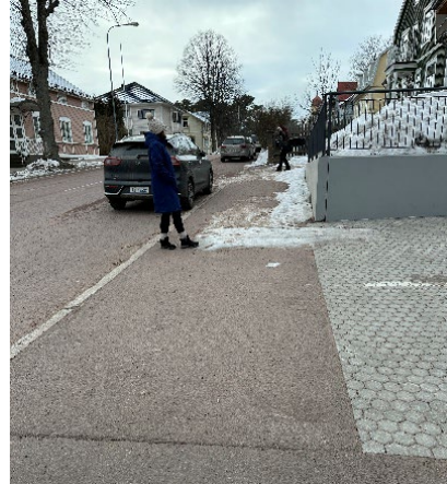
Bild 2. Plats för att stanna till, utanför entrén.

Det finns enbart tre parkeringsplatser utanför bion och inte någon plats för personer med särskilt tillstånd. Vi rekommenderar att anlägga en sådan p-plats utanför. Det finns vanligtvis få lediga p-platser på gatan direkt i anslutning till bion, besökare är ofta tvungna att parkera längre bort och till exempel ta sig över Ålandsvägen som ofta är mycket trafikerad. Det finns plats direkt utanför entrén att tillfälligt stanna med exempelvis en större taxibil.