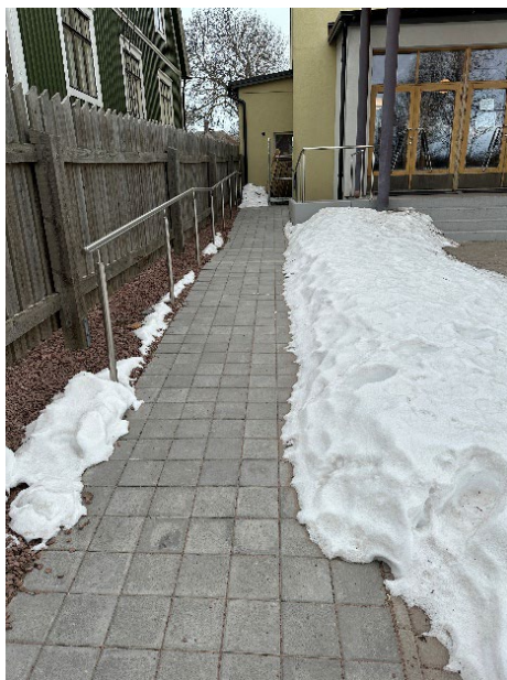
Bild 3. Vägen till den nya rampen.

Från gatan till entrén är det en nedsänkt kant som är lätt att ta sig över med t.ex. rullstol. Det finns inte kontrastmarkeringar eller taktila plattor på gatan eller vägen fram till entrén. Trappan är bred, den saknar kontrastmarkeringar och ledstång. Ledstång rekommenderas vara på en höjd av 90 cm på bägge sidor.