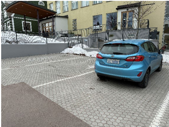
Bild 1. Parkeringsplatser utanför Bio savoy.