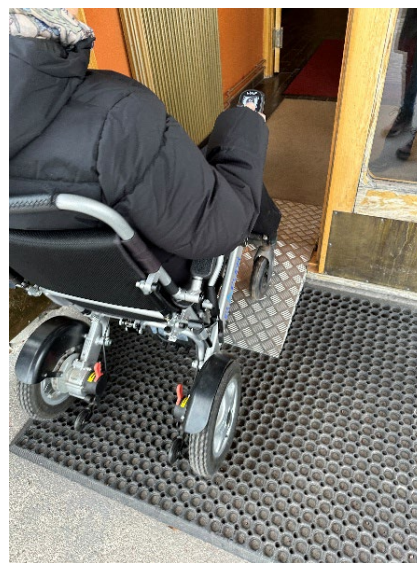
Bild 7. Tungt komma över med rullstol.

Innanför entrén leder en gång på vänster sida till biljettförsäljningsluckan. Den är avskild från resten av utrymmet med ett rep. Ett bord på vänster sida intill biljettluckan är något i vägen för t.ex. en bredare elrullstol och kan behöva flyttas, i övrigt är gångens bredd tillräcklig. Biljettluckans öppning är liten, med en till rundad öppning i glaset ovanför. Besökare med nedsatt hörsel kan eventuellt ha svårt att höra personalen på andra sidan glaset. Vi tipsar om att man kan ha en hörselslinga för receptioner. Intill luckan där man betalar kontant finns även en betalautomat för bankkort. Luckan är på en höjd av 105 cm, vilket funkar att använda även från sittande.