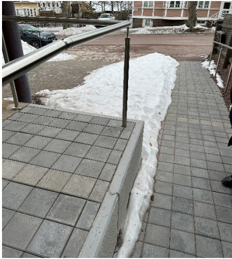
Bild 5. Rampens hörn, avåkningskydd saknas.

tillgängligheten. Vår tillgänglighetsgrupp testade rampen med elrullstol och det fungerade bra att komma upp och ner. Rampens bredd är godkänd, där rampen svänger finns ett vilplan vilket är bra. Vid vilplanet står en rullställning för varor, det är bra att tänka på att den behöver vara ur vägen så att man kommer förbi även med större elrullstolar.