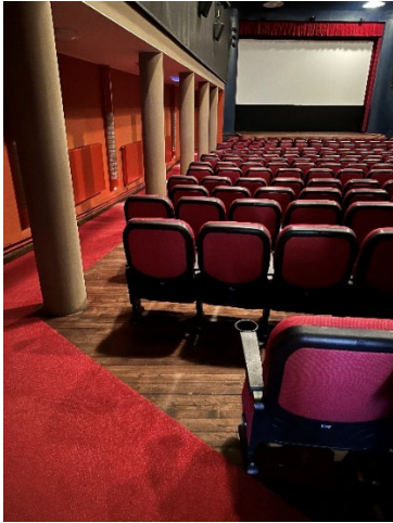
Bild 10. Plats för rullstol i salongen.