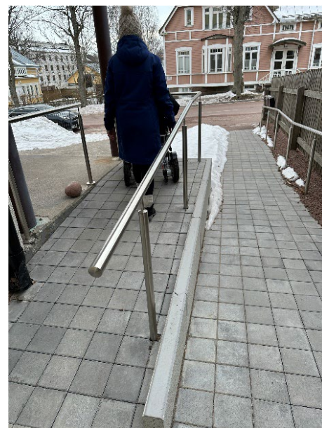
Bild 4. Rampen från andra hållet.