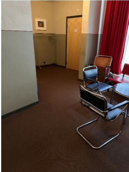
Bild 13. Vägen till lilla salongen samt toaletten.