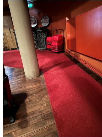
Bild 11. Gången i salongen sluttar uppåt, ledstång saknas.

Salongen är i originalutformning med vissa uppdateringar som att biofåtöljerna bytts ut. Golvet sluttar brant ner mot bioduken, och är därmed svårt att ta sig upp och nedför med hjälpmedel eller om man har svårt att gå. Kilar att sätta under hjulen till en rullstol erbjuds till besökare av personalen, om man har en sådan.