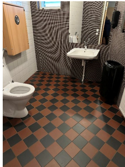
Bild 14. Den tillgängliga toaletten.

I närheten av lilla salongen finns en tillgänglig toalett. Dörrmåtten är 85 cm vilket är godkänt. Utrymmet är tillräckligt stort med svängradie för en rullstol på 150 cm.