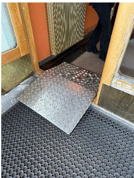
Bild 6. Plåtramp sätts över tröskeln.