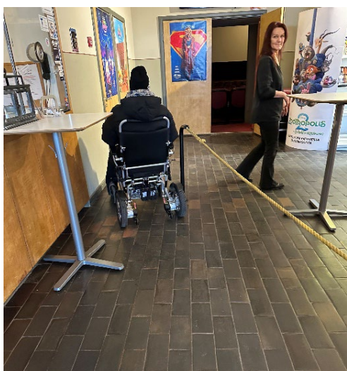
Bild 8. Vägen till biljettluckan är avskärmd med rep.

Innanför entrén leder en gång på vänster sida till biljettförsäljningsluckan. Den är avskild från resten av utrymmet med ett rep. Ett bord på vänster sida intill biljettluckan är något i vägen för t.ex. en bredare elrullstol och kan behöva flyttas, i övrigt är gångens bredd tillräcklig. Biljettluckans öppning är liten, med en till rundad öppning i glaset ovanför. Besökare med nedsatt hörsel kan eventuellt ha svårt att höra personalen på andra sidan glaset. Vi tipsar om att man kan ha en hörselslinga för receptioner. Intill luckan där man betalar kontant finns även en betalautomat för bankkort. Luckan är på en höjd av 105 cm, vilket funkar att använda även från sittande.