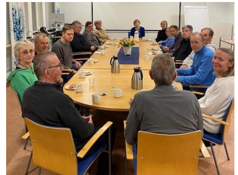
Samtalsträff & fika för Parkinson stödgrupp

Stödgrupperna har haft varierad mängd aktiviteter och träffar och styrs beroende av behov och intresse från medlemmar. Mest aktivitet under 2025 har Parkinsongruppen och MS-gruppen haft.