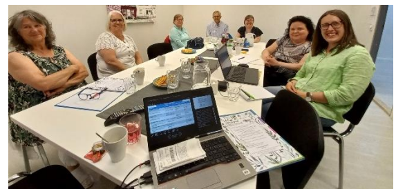
Möte med Invalidförbundet och svenskspråkiga föreningar i Finland