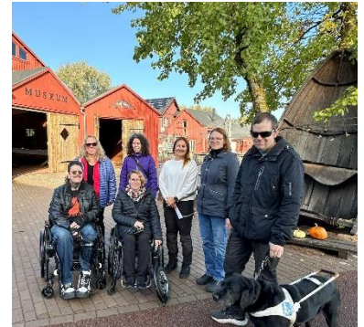
Tillgänglighetsgruppen vid Sjö kvarteret