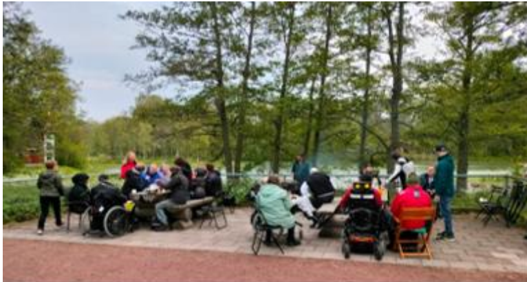
Grillkväll vid Lilla Holmen