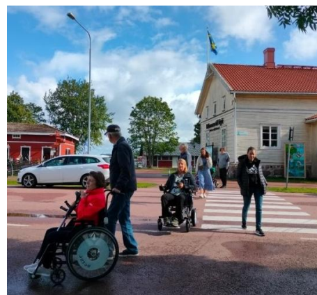
Utflykt till Föglö i augusti

För föreningen är det viktigt att erbjuda medlemmar möjligheter att träffas och upprätthålla ett socialt liv. När föreningen gör utflykter känns det för medlemmarna befriande att tillsammans vara en grupp med olika funktionsnedsättningar och att alla har samma rätt att röra sig i samhället. När man på egen hand besöker ett evenemang eller en restaurang är det vanligt att man blir iakttagen för att man sticker ut på något sätt. Något många upplever som jobbigt. Som grupp känner man en gemenskap och att man får ta plats.