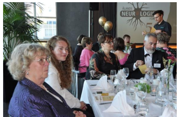
Jubileumsfest på Alandica

Föreningen har under året ordnat flera föreläsningar som en del av jubileumsfirandet samt en utflykt till Föglö. Vi har även erbjudit rabatterade biljetter till flera föreställningar på Alandica. En öppen föreläsning med Jonas Helgesson – komiker, författare och föreläsare från Sverige, planerades till hösten 2025 men behövde skjutas fram till våren 2026 på grund av sjukdom. Ett stort ideellt arbete med att samla in information och bilder för att sammanställa en historik över föreningens 50 första år påbörjades under hösten. Boken planeras vara klar för utgivning under mitten av 2026.