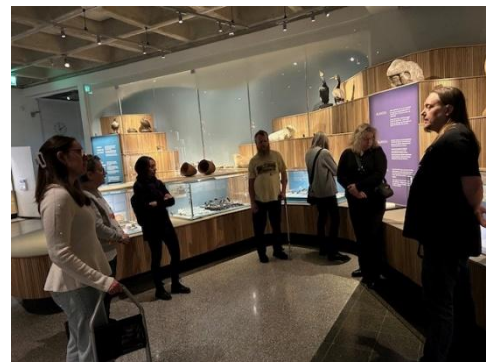
Guidad tur på Ålands museum med stödgruppen för stroke