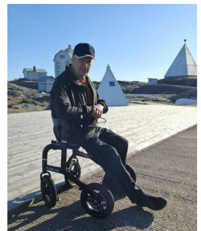
Kobbå Klintar i härligt sommarväder