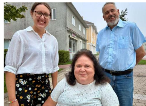
Intervju i Ålands Radio

❖ Inför föreningens jubileumsfest besökte verksamhetsledaren, ordförande och vice ordförande Ålands Radio för att prata om föreningen. Vi lyfte även många medlemmars stora utmaningar: behov av personlig assistans, stadens tillgänglighet och tillgång till färdtjänst.