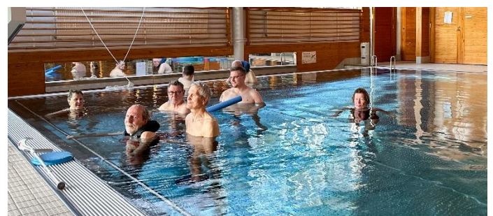
Träning i bassäng