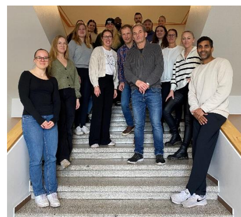
Besök vid Högskolan på Åland

❖ Föreningens verksamhetsledare och två medlemmar med Parkinsons sjukdom besökte Högskolan på Åland under hösten. Vi informerade om föreningen och hur vardagen med sjukdomen ser ut. Åhörare var sjukskötarstuderande på sista terminen vid sjukskötarprogrammet.