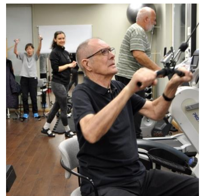
Träning vid Rehab City