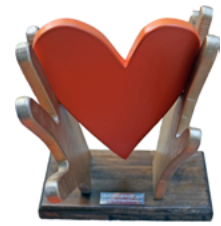
Bild 2. Bemötandepriset i trä som görs av Fixtjänst.

Skriv en kort motivering och skicka till: reception@handicampen.ax eller per post/personligen till: Funktionsrätt Åland, Skarpansvägen 30, 22100 Mariehamn, eller ring till: 018-22 360.