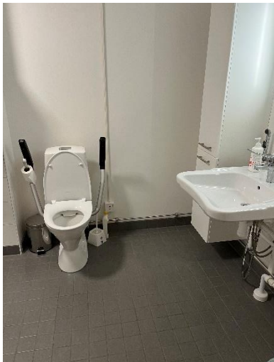
Bild av toalett nedre plan.