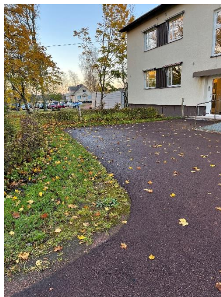
Bild med vy mot andra ingången.