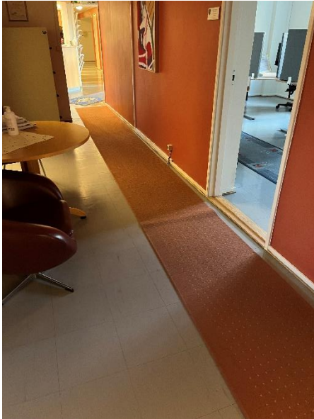
Bild på lös matta i korridor.

korridorens golv på nedre plan till höger om receptionen mot den tillgängliga toaletten och fullmäktigesalen finns vita ränder. Dessa ränder är förvirrande för till exempel personer med kognitiv funktionsnedsättning och det kan uppfattas svårt att orientera sig. Det saknas ledstråk i alla korridorer.