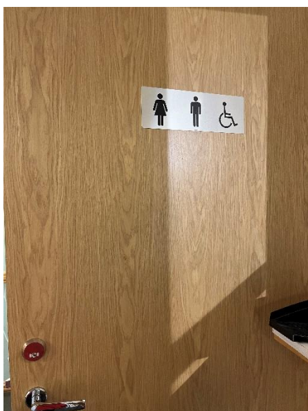
Bild av skyltning toalett övre våning.

Det finns en visuell skylt på dörren. Toaletten är även utrustad med larm, det finns även tillgång till larm på golvnivå. Toalettstolen har armstöd på bägge sidor. Toalettpappershållaren är lätt att nå och det finns tillräckligt utrymme på bägge sidor om toalettstolen. Spegeln är i bra höjd och det finns en kran som kan användas med enhandsgrepp.