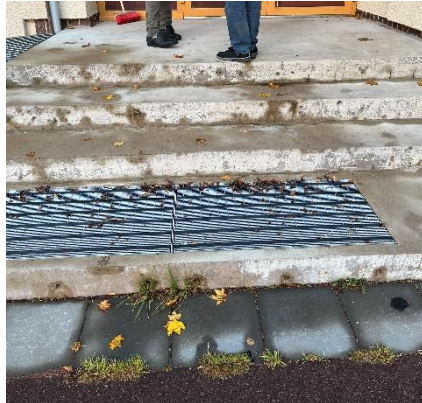
Bild på trappan upp till huvudingången.

avfasad. En låg tröskel eller avfasad tröskel är viktig för att minimera snubbelrisken och för att göra passagen lättåtkomlig för alla.