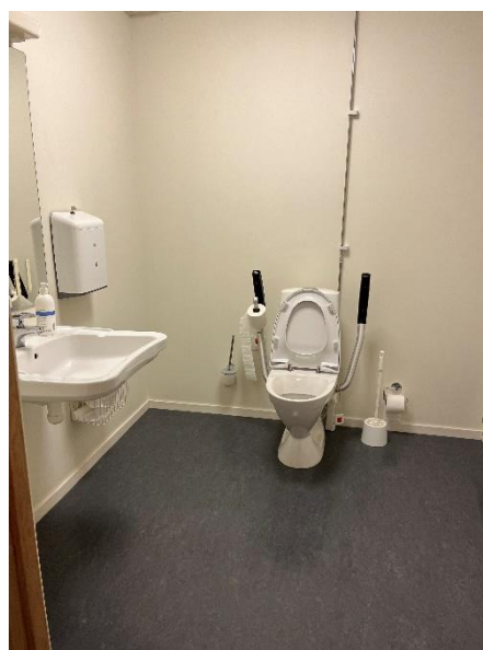
Bild på anpassad toalett med armstöd.