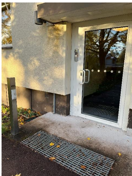
Bild av markerad glasyta

Direkt från parkeringen kan man gå genom en ingång vid sidan om huvudentrén för att komma till hissen. Det finns ingen tröskel. Glasytan på dörren har kontrastmarkering. Det finns trappor inomhus, första och sista trappsteget behöver kontrastmarkeras. Det finns en hiss till andra våningen och den fria ytan utanför samt innanför hissen är godtagbar. Dörren till hissen öppnas med handkraft och det går i gång en automatisk dörröppnare, hissdörren hålls inte öppen länge (mellan 6–7 sekunder). Om man inte hinner in eller ut väger dörren tungt mot individ eller föremål.