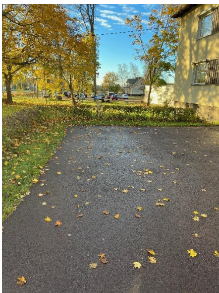
Bild på parkeringsplatsen.

Parkeringsplats för de med särskilt tillstånd finns i närheten av entrén och parkeringsplatsen är tillräckligt stor. Det saknas dock markering på asfalten. I byggnaden finns tillgänglig hiss upp till andra våningen. En ramp finns vid huvudentrén. Det är mindre än 25 meter från parkeringen till den andra entrén och huvudentrén. Markunderlaget är fast och jämn asfalt.