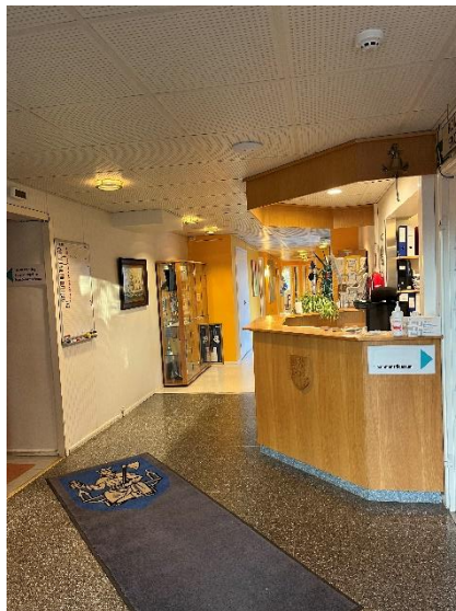
Bild av receptionen via huvudentrén.

Det finns allergivänliga plantor i receptionen. Det saknas en sänkt del i receptionsdisken med en höjd på max 75 cm för kortväxta personer och personer i rullstol. Det finns ingen tillgång till hjälpmedel såsom Teleslinga för de med hörselnedsättning och det saknas skyltning för enklare orientering. Ledstråk från receptionen till övriga utrymmen är ett åtgärdsförslag som listas på sida nummer 7. Det finns även ett störande ljud från ventilationen vid entrén invid receptionen som inte kan påverkas så mycket, den är inte på hela tiden utan slås av och på.