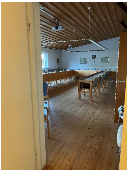
Bild av fullmäktigesalen.

Dörrbredden har rätt mått. Belysningen verkar tillräcklig, det krävs en expert för ett utlåtande av belysningen. Det finns även tillgång till persienner för att avskärma dagsljus. Det fattas skylt som talar om vad det är för rum och Teleslinga i rummet.