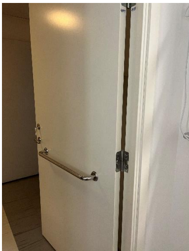
Bild av draghandtag på dörren.