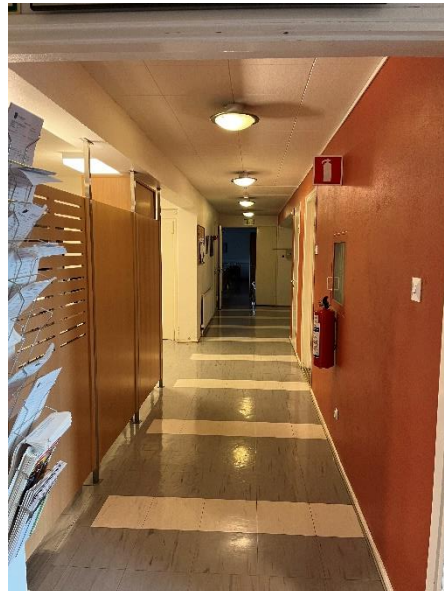
Bild på ränder i korridor.