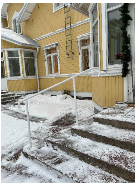
Bild 4 visar ledstång vid yttertrappan.