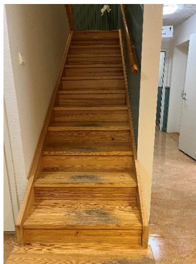
Bild 10 av trappan inomhus.

Det finns ingen hiss till andra våningen, det finns trappor. För att underlätta användningen av trappan bör det första och sista trappsteget kontrastmarkeras. Det finns en ledstång, för att förbättra tillgängligheten bör ledstången förlängas så att den börjar 30 centimeter före trappans början och sträcker sig 30 centimeter efter trappans slut.