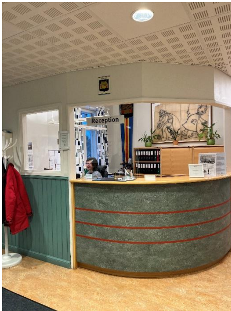
Bild 6 visar receptionsdisken.

Det saknas en nedsänkt del av receptionen som är 0,75 cm därav är receptionsdisken inte tillgänglig. Vid receptionen hänger ett gammaldags urverk vilket ibland kan vara högljutt, det kan uppfattas som störande.