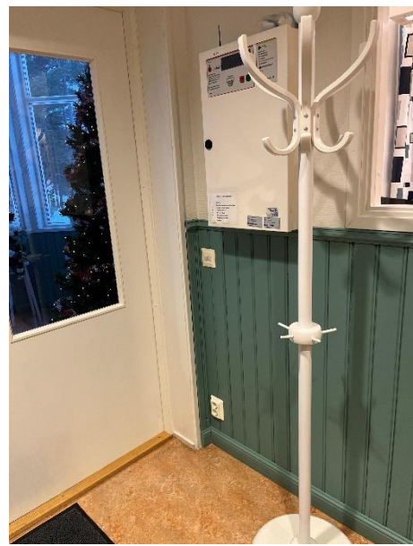
Bild 7 visar klädmajoren i receptionen.