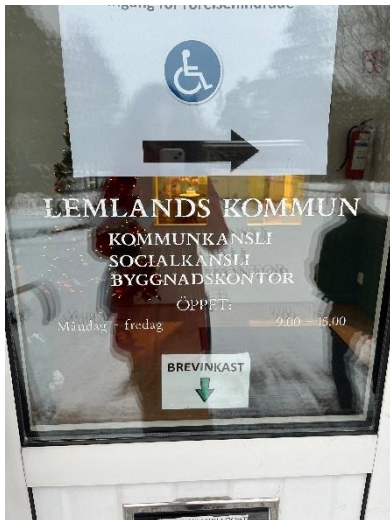
Bild 8 visar skylten av kommunkansliet

I receptionen finns det skyltar med god kontrast som vägleder besökarna vart i byggnaden de ska. Skyltarna vid dörrarna som hänvisar till vem man besöker har orange bakgrund och svart text, kontrasten mellan dessa är inte tillräckligt god. Det kan uppfattas som svårläst.