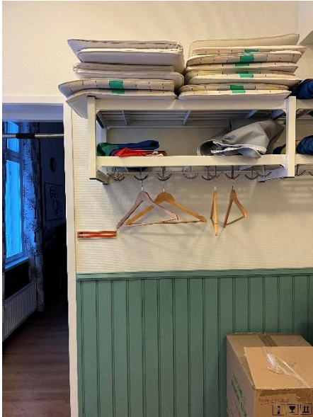
Bild 11 klädhängare personalrum.

På väg in till personalrummet finns en klädhängare som är upphängd på väggen. Det rekommenderas att sätta en kontrastmarkering för att göra den synlig. Det finns en risk att slå huvudet i den då den sticker ut från väggen. Krokarna finns, det skulle även vara bra att sätta krokarna på väggen på en lägre nivå. Kök och personalrum är i samma utrymme. Rummet är rymligt med god svängyta. Det är låg tröskel in till rummet och det finns markiser för att avskärma dagsljuset. Ljudmiljön är god och fri från buller samt efterklang.