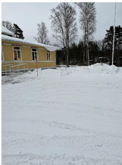
Bild 1 på parkering.

Det gick inte att se om det finns markeringar på asfalten som indikerar att det är en parkering för personer med särskilt tillstånd.