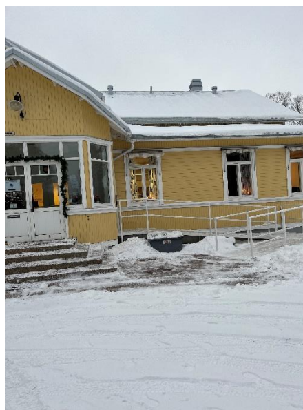
Bild 3 visar rampen till huvudentrén.