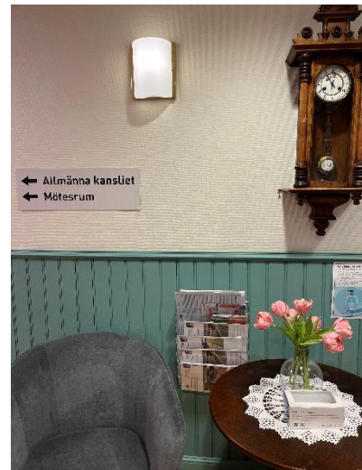
Bild 9 visar skyltning inomhus.

Om man bygger om toaletten på bottenvåningen till en tillgänglig toalett underlättar det om skylten på dörren till toaletten har punktskrift eller relief och är en symbol i stället för text. Detta för att inkludera personer med kognitiv funktionsnedsättning, personer med nedsatt syn och personer som har svårt med för många intryck.