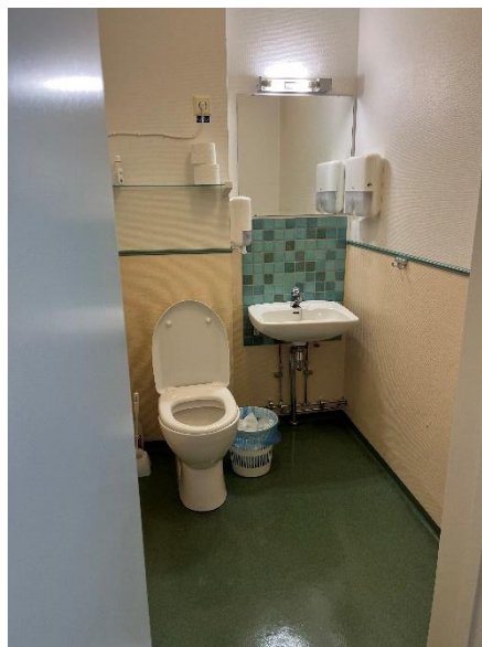
Bild 13 toalett vilken kan bli tillgänglig.

Det finns tre toaletter på bottenvåningen men det finns ingen tillgänglig toalett i hela byggnaden. Vid korridoren bredvid receptionen finns en toalett och en städskrubba. Det finns möjligheter att göra den toaletten tillgänglig genom att ta bort väggen till skrubben och omvandla utrymmet för att göra en tillgänglig toalett. Idag är toaletten 1,60 meter djup och 1,30 meter bred, om väggen försvinner finns det gott om plats. Dörrbredden är idag 68 centimeter och behöver göras bredare så att den är minst 80 centimeter bred.