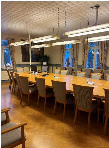
Bild 14 av sammanträdesrummet.

Dörren in till sammanträdesrummet består av pardörrar och de har acceptabel dörrbredd. Det finns icke-allergena växter i form av plastblommor. Belysningen förbättras gradvis, det tar en liten stund innan de kommer i gång. Höjden på borden är bra och det går att flytta på stolarna så att personer med hjälpmedel kan sitta vid borden. Det här rummet är välbesökt och det är en rymlig lokal med god svängyta.