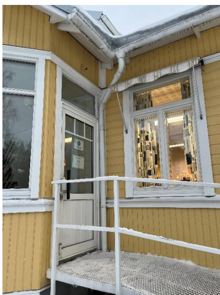
Bild 2 visar avsatsen av rampen.

Rampen som leder in har lagom lutning med vilplan. Avsatsen framför entrén är för kort, den bör vara 1,5 meter x 1,5 meter för att personer med hjälpmedel ska kunna vända vid dörren. Det finns snörasskydd men under vintern när snön smälter på taket så droppar det ner vatten på individen som står vid rampen på väg in. Det finns ingen automatisk dörröppnare och dörren är låst. Dörrklocka finns och någon kommer för att öppna dörren. Den fria passagebredden till entrén är acceptabel, den är 0,80 centimeter. Det finns en tröskel på 30 millimeter som leder in vilken bör vara högst 20 millimeter för att vara tillgänglig.