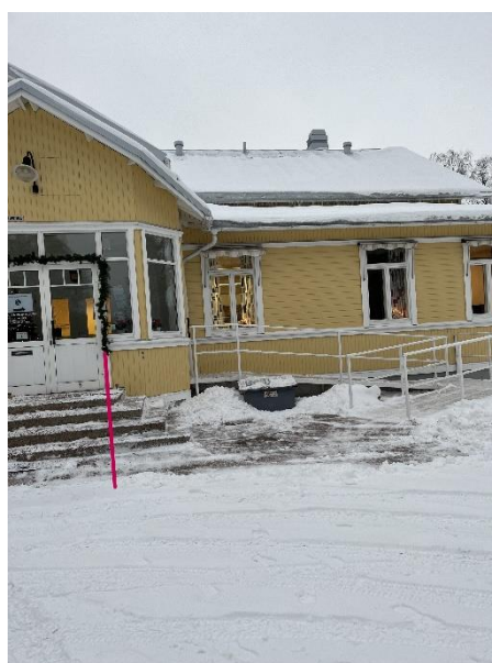
Bild 5 exempel på placering av ledstång.