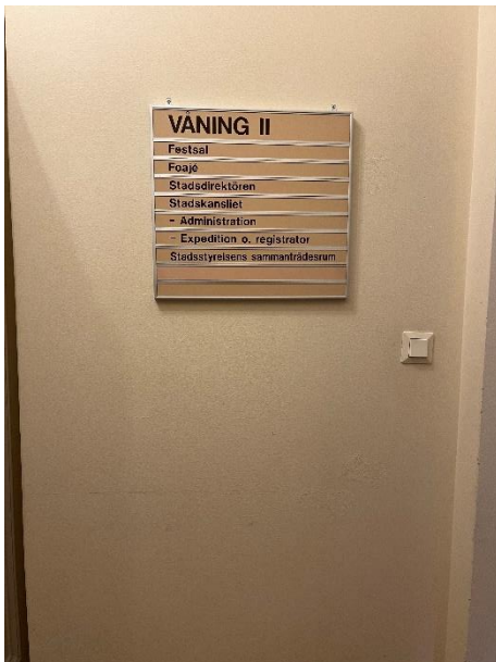
Bild 16 på skyltning våning två.

De skyltar som finns är inte lätta att se och skyltningen till alla allmänna utrymmen är bristfälliga för enkel orientering. Det är kallt på vintern i byggnaden och varmt på sommaren, ventilationen är inte så god. Ventilationen består av luckor på byggnaden som man öppnar och vintertid håller man dem stängda.