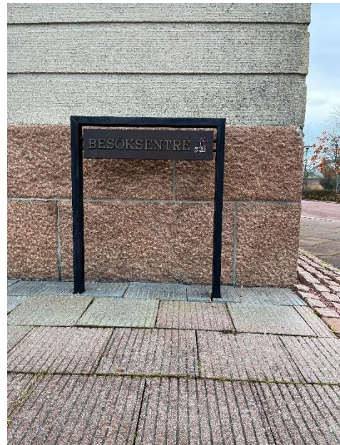
Bild 3 av infoskylten till huvudentré.