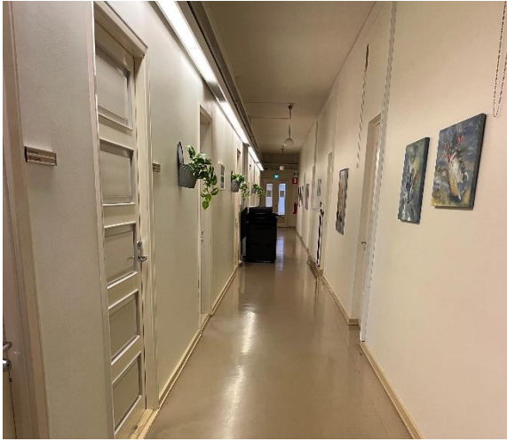
Bild 12 på skrivare och element i korridor på våning tre.