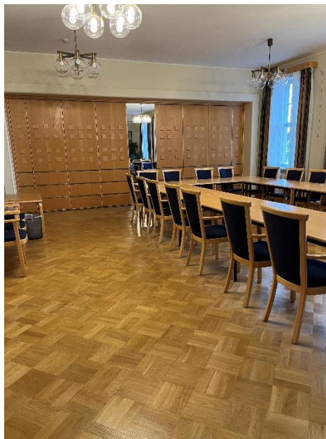
Bild 14 på Norra och södra foajén.

På andra våningen finns dessa foajéer och det går att öppna upp till ett enda stort rum. Här finns även möjligheter att avskärma dagsljus. Det finns ett bländande ljus i taket. I dessa rum går det att möblera om för att göra det mer tillgängligt.