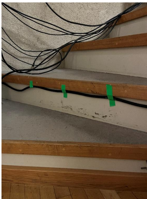
Bild 11 av trappor upp till scenen med trappnos.

Dörrbredden in till festsalen är tillräcklig och det finns möjligheter att möblera om stolar så att personer med hjälpmedel kan sitta. Det finns trappor med en ledstång upp till scenen. Trapporna har en kant, dessa kallas för trappnos, som sticker ut vilket kan försvåra när man ska gå uppför trappan. Det finns risk att fastna och snubbla, (se bild 11). Det finns tillgång till Teleslinga i detta utrymme.