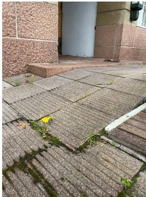
Bild 4 av ramp utanför norra entré, saknar avåkningskydd.