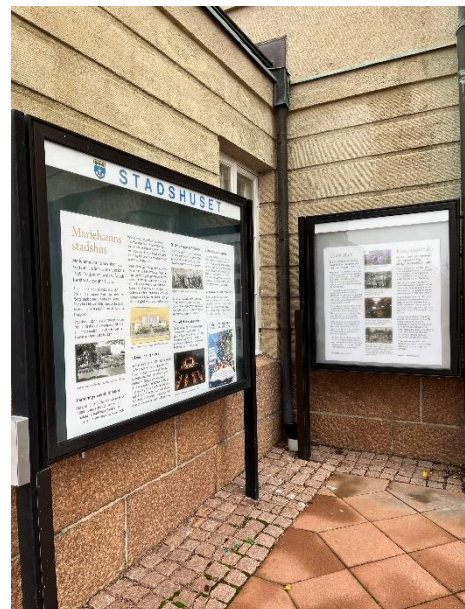
Bild 17 av skyltningar vid huvudingång.