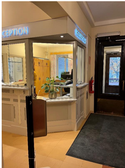
Bild 5 av receptionen med full belysning bakom texten.

Det finns en skylt som lyser ovanför receptionen på vardera sida om disken. Med stark belysning bakifrån framträder bokstäverna bättre vilket ger texten en skuggning, annars syns texten inte så bra. Det finns inga skyltar i utrymmet, här anmäler man sitt besök och en person dyker upp för att hämta individen. Det finns teleslinga och det finns tillgång till en ringklocka. Det finns en sänkt del av receptionen som är anpassad för tillgänglighet. Rakt framför receptionen finns kapprum, tillgänglig toalett, trappor och en hiss. Dörrar till korridorerna är låsta och öppnas av receptionisten.